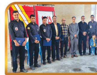
تقدیر از آتش نشانان شهر به مناسبت ۷ مهر روز آتش نشانی