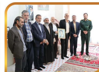
دیدار با خانواده معظم شهدا در مناسبت های مختلف در طول سال