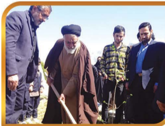
آماده سازی شهر جهت حضور آیت اله مهدوی در روز درختکاری و کاشت درخت، افتتاح خانه هلال و جلسه گفتمان دینی