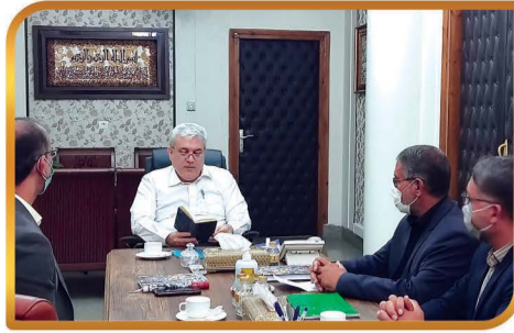
دیدار با دکتر سورنا ستاری معاون علمی و فناوری رئیس جمهور

آذین بندی شهر و استقبال از مسافران نوروزی و برپایی نماز جماعت در بوستان لاله در ایام نوروز حضور در برنامه نوروزگاه چهلستون اصفهان و معرفی شهر و ظرفیت ها (مشاغل خانگی، صنایع دستی و...) همکاری در اجرای برنامه جشنواره قرآنی طالخونچه در مجموعه باغ بانوان مبارکه حضور در کارگاههای گلاب گیری شهر و حمایت از کار آفرینان شهر همکاری در اجرای دو برنامه همایش اینتاگران شهر در مجموعه باغ بانوان شهرداری حضور پرسنل شهرداری در گلستان شهدای شهر به مناسبت سوم خرداد سالروز آزاد سازی خرمشهر همکاری در برگزاری همایش فرزندان آوری در خرداد ماه در مجموعه شهید آوینی شهرداری بازدید از کتابخانه های شهر - همکاری با ایشان و اهدای کتاب میزبانی برگزاری جلسه توجیهی شوراهای حل اختلاف شهرستان در مجموعه شهید آوینی برگزاری مراسم عزاداری در ایام دهه محرم و شهادت حضرت زهرا (س) در شهرداری دعوت از گزارشگران صدا و سیما واحد خبر جهت تهیه اخبار شهر همکاری در اجرای برنامه های 13 آبان با قرارگاه فرهنگی شهر