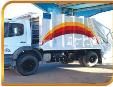
تمویش و تجهیز کامیون حمل زیاله