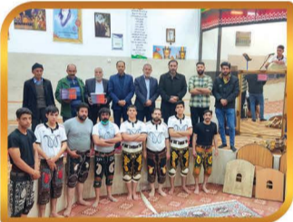
حضور و همراهی با رؤسای اداره ورزش و جوانان و هیات باستانی شهرستان در زورخانه پوریای ولی و تقدیر از پیشکوتان این ورزش