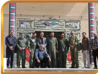
دعوت از خلبانان هوانیروز جهت گلباران گلستان شهدای شهر به مناسبت هفته دفاع مقدس