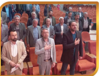
کمک نقدی در مراسم گلریزان جهت نیازمندان شهر