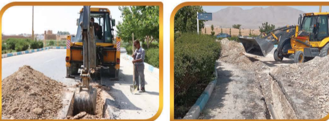
همکاری در حفاری و لوله گذاری قسمتی از خیابان انقلاب جهت اتصال آب منبع سینه کش به محله شمس آباد