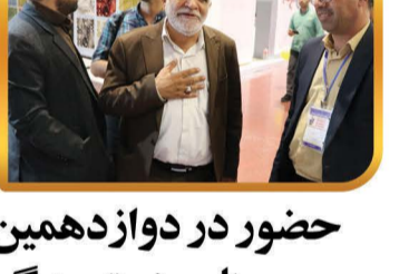
حضور در دوازدهمین نمایشگاه بین المللی صنایع دستی و گردشگری اصفهان