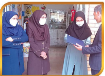
تقدیر از معلمان مدارس شهر به مناسبت روز معلم