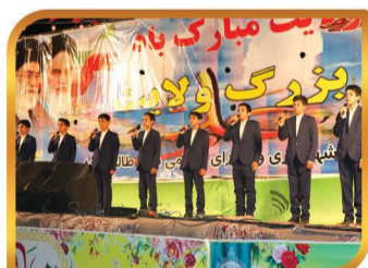
برگزاری جشن بزرگ غدیر خم در تیر ماه