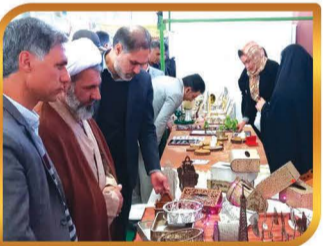
همکاری در برگزاری نمایشگاه مشاغل خانگی مسجد الرضا (ع) در دهه فجر