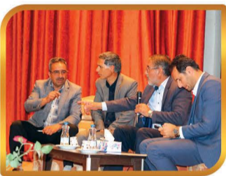
برگزاری جلسه با مالکان منطقه کارگاهی امیر کبیر و به سرانجام رساندن آب شرب این منطقه با همکاری اداره آبفای شهرستان و مالکان

واریز قدر سهم کتابخانه های شهر در سال ۱۴۰۱ به مبلغ ۵۵۰/۰۰۰/۰۰۰ ریال حمایت از نخبگان شهر و راه اندازی دفتر نخبگان در مجموعه شهید آوینی همکاری با نهادهای فرهنگی شهر در خصوص اجرای برنامه های فرهنگی همکاری با دفتر امام جمعه محترم در خصوص برنامه های قرارگاه فرهنگی شهر همکاری با گروه جهادی شهید علی اکبر عبدی جهت ساخت خانه محرومیت زدایی همکاری در برنامه زنگ مهر به مناسبت آغاز سال تحصیلی در دبیرستان بانو کرمی