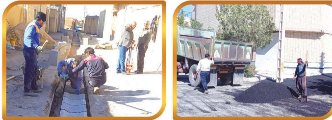
لکه گیری و آسفالت و کانپو گذاری معابر شهر

تعویض و ایمن سازی تیر های برق فشار قوی میدان امام حسین (ع)