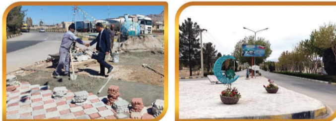
طراحی فضای سبز و بلوک فرش رفیوژ میانی بلوار امام خمینی در ورودی شهر به طول ۲۷۰ متر و سطح بلوک فرش ۸۱۰ متر مربع و هزینه کرد بالغ بر ۷۰۰/۰۰۰/۰۰۰ ریال بصورت امانی توسط پرسنل شهرداری با صرفه جویی مبلغ ۱/۵۰۰/۰۰۰/۰۰۰ ریال