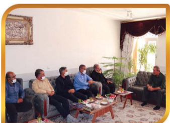
دیدار با آزادگان به مناسبت سالروز بازگشت آزادگان سرافراز