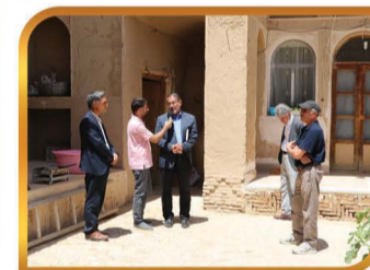
دعوت از گزارشگر برنامه سفر با رادیو برای معرفی شهر در رادیو اصفهان