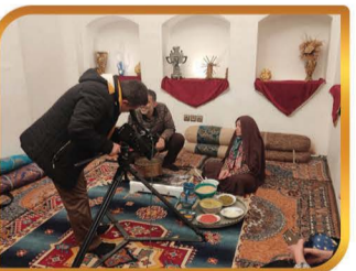
دعوت از عوامل برنامه صبحونه شبکه اصفهان و ضبط و پخش ۷ گزارش از شهر در این برنامه