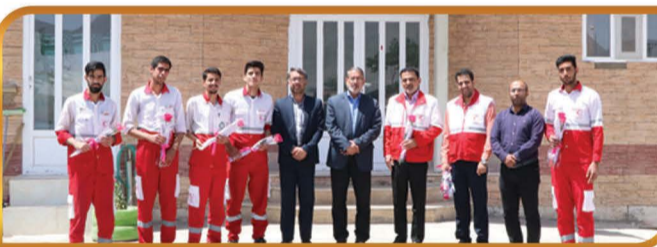
حضور و تقدیر از امدادگرهای پایگاه جاده ای هلال احمر طالخونچه به مناسبت هفته هلال احمر