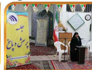
جلسه پرسش و پاسخ با حضور نماینده محترم شهرستان و جمعی از مردم شریف شهر در مسجد حضرت سجاد(ع)