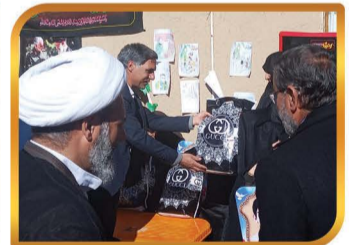
تقدیر از مادران و همسران شهدا