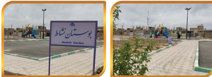
اجرای پارک محله خراب (بوستان نشاط) به مساحت ۱۶۵۰ متر مربع و اعتباری بالغ بر ۴/۴۲۳/۷۰۰/۰۰۰ ریال با استفاده از ظرفیت ماشین آلات و پرسنل شهرداری که در این پروژه مبلغ ۲/۷۰۰/۰۰۰/۰۰۰ ریال صرفه جویی شده است