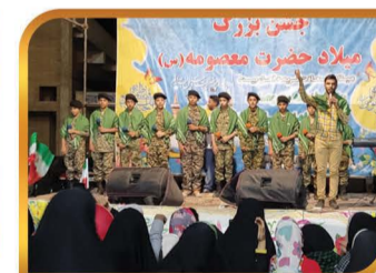
برگزاری جشن بزرگ میلاد حضرت معصومه (س)