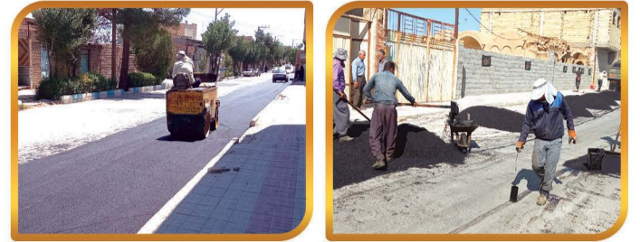
تعریض خیابان شهید مطهری به طول ۲۹۰ متر شامل آزاد سازی ، جدول گذاری ، زیر سازی و آسفالت

زیر سازی معابر خاکی محله های خراب و چهل دستگاه و مجموعه مسکونی یاس زیر سازی ، لکه گیری آسفالت و اجرای رفیوژ میانی خیابان جهان پهلوان تختی آماده سازی و ایجاد دپو خاک جهت جلوگیری از ورود سیلاب به منازل مسکونی شهر