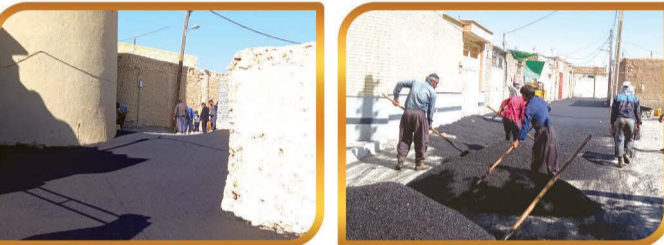
آسفالت معابر محله های هدف بافت فرسوده