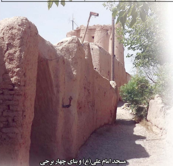
مسجد امام علی (ع) و بنای چهار برجی