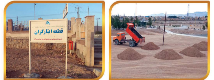
زیر سازی پارکینگ آرامستان و جانمایی قطعه اینارگران شهر