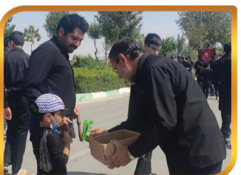
روایت خادمی امام حسین (ع) در روز عاشورا