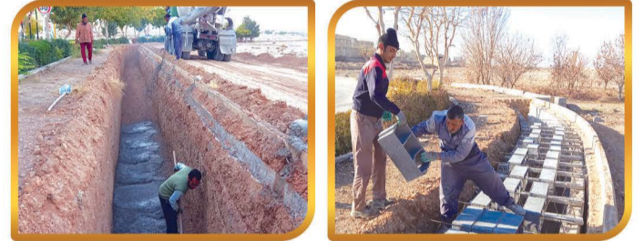
اجرای کانالهای هدایت آبهای سطحی خیابانهای ولیعصر و بلوار امام خمینی(ره) به طول ۴۲۰ متر

همکاری در خاک ریزی و تسطیح زمین چمن ورزشگاه شهدای هفتم تیر شهر