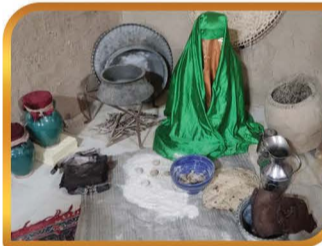
همکاری در برگزاری نمایشگاه نگین شکسته به مناسبت دهه فاطمیه