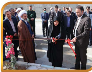
اجرای مراسم افتتاحیه پروژه های اجرا شده و در دست اجرای شهرداری با حضور مسئولین شهر و شهرستان به مناسبت هفته بسیج