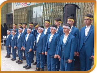
همکاری در برگزاری جشن های نیمه شعبان