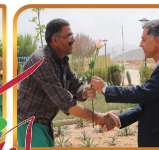
تقدیر از کارگران زحمتکش شهرداری به مناسبت روز کارگر

همکاری با موسسه نورالزهرا در خصوص برنامه های فرهنگی و قرآنی شهر و برنامه 14 قدم تا بهار همکاری در برگزاری جلسه بصیرتی دانش آموزی به مناسبت 9 دی روز بصیرت همکاری در برگزاری مراسم سالگرد شهادت سردار سلیمانی، برنامه های هفته بسیج و دهه فجر همکاری در برگزاری جشن میلاد حضرت امام محمد باقر(ع) در مجموعه شهید آوینی شهرداری همکاری با مرکز بهداشت شهر در اجرای برنامه ها و کلاسهای خانواده و بهداشت