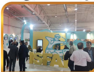
شرکت در نمایشگاه بین المللی گردشگری و صنایع وابسته در مصلی امام خمینی تهران