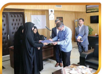
تقدیر از بانوان شهرداری به مناسبت هفته عفاف و حجاب