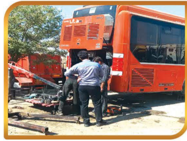
تعمیر اتوبوس های واحد