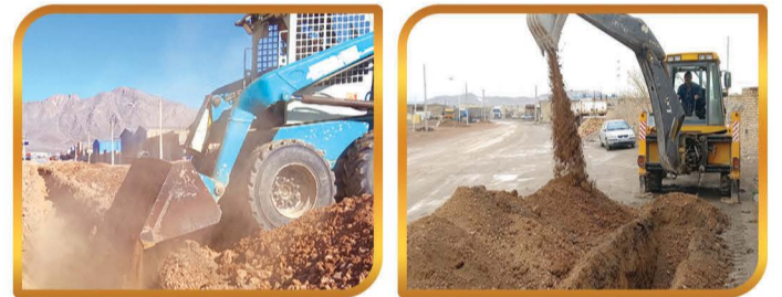
همکاری با اداره آبفا شهرستان و هیأت امنای منطقه کارگاهی جهت تامین آب شرب منطقه کارگاهی امیر کبیر شامل حفاری و پر کردن کانالهای انتقال آب به طول ۳۰۰۰ متر